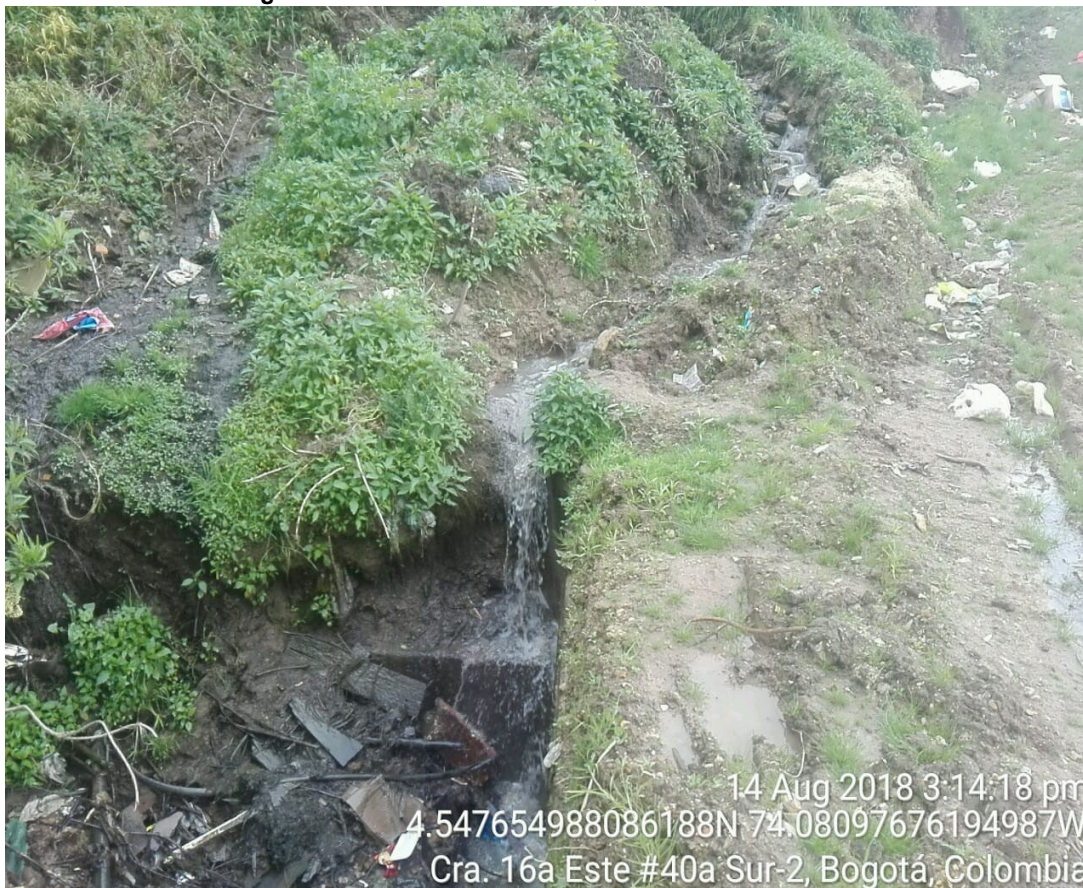
Fotografía No. 2. Puente sobre la Quebrada Toches vía de acceso