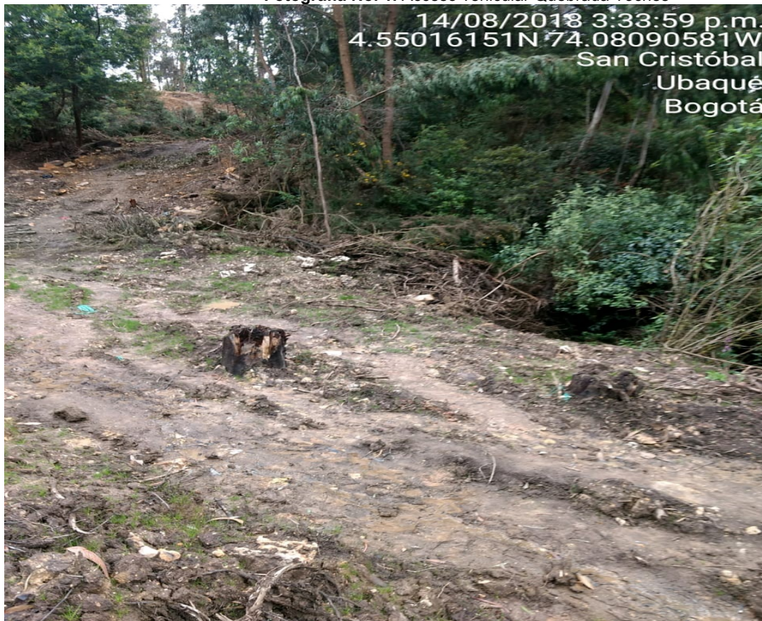
Fotografía No. 1. Acceso vehicular Quebrada Toches

Se observó un puente ya constituido que atraviesa la Quebrada el cual no se logra verificar el Permiso de Ocupación de Cauce – POC correspondiente ni identificación de fecha de construcción, este puente es una de las vías de acceso a la zona de intervención.